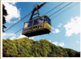
「ロープウェイで「一気に山頂へ!」