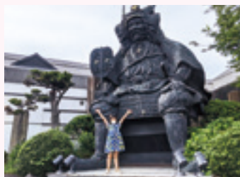
【県内最大の信玄公像】