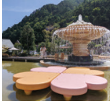
「滝の裏にも入れるクリスタルファウンテン」