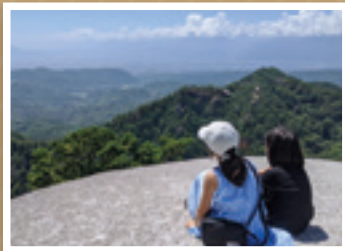
「弥三郎岳山頂は雄大なパノラマ」