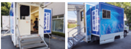
【災害時にも稼働ができる移動店舗車】

この8月から、当組合が有する県内金融機関唯一の移動店舗車が、移転した店舗の跡地で営業を行っています。 この移動店舗車は、荷台にお客様に対応するための窓口設備を備えた自動車で、職員が搭乗し、入出金や振込等の窓口業務を行い、ATMも搭載し、お客様の操作での入出金等も可能となっています。 全国で注目を浴びている移動店舗車のご利用については、組合ホームページや移転した店舗跡地の掲示で運行状況や営業時間等をご確認ください。 また、この移動店舗車は、発電機を装備し、停電になった場合でも稼働が可能ことから、災害時に被災地を運行し、地域の金融機関として金融機能を発揮することも役割としています。