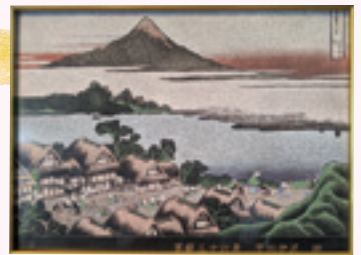
【富嶽三十六景「甲州伊沢暁」】(石を点刻した画)