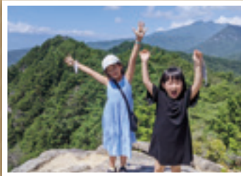
「ロープウェイを降りて、すぐの展望台も絶景」