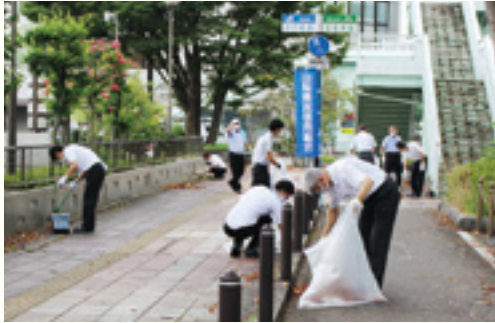
【本部と本店営業部】

9月1日から7日は、「しんくみの日週間」です。全国の信用組合では、この期間を中心に、日ごろの感謝を込めて様々な取り組みを行っています。当組合においても、今年度は、全店における清掃奉仕活動、献血者数が減少している中での献血運動、コロナ禍により業況が低迷している飲食店のテイクアウト等を従業員が積極的に利用する「一人一応援運動」等を実施いたしました。