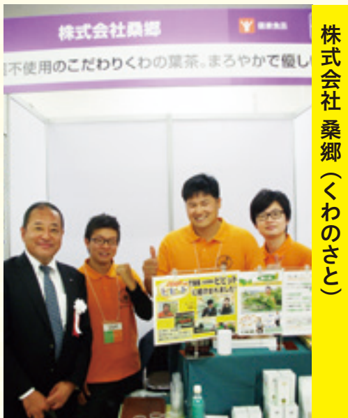
株式会社桑郷(くわのさと)