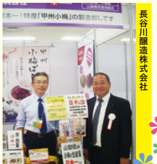
長谷川醸造株式会社