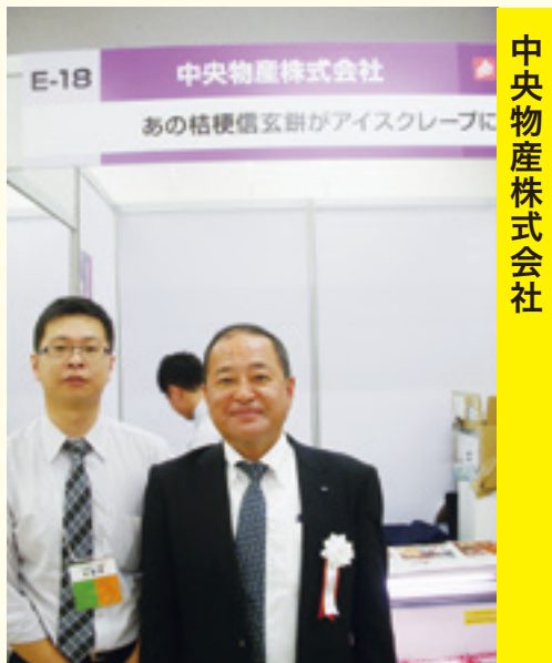
中央物産株式会社