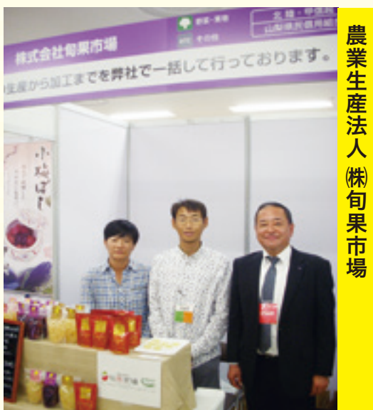
農業生産法人(株)旬果市場