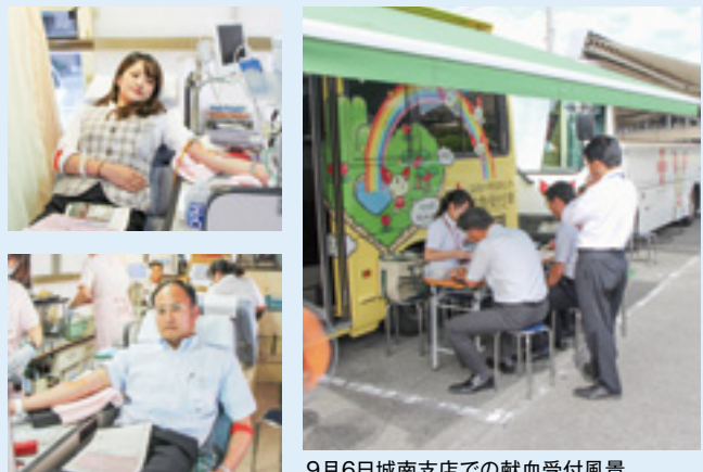
9月6日城南支店での献血受付風景

また、こうした取り組みとともに、甲府地区につきましては、役員が「ココリビル」2階の甲府献血ルーム「グループ」での献血に参加し、その他の地区でも各市町村等で実施される献血に職員が協力するなど、当組合では積極的な献血活動を行っています。