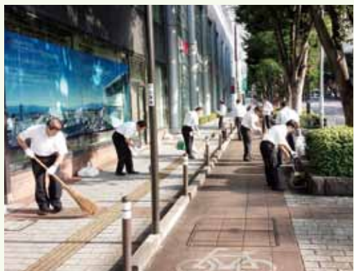
平和通り歩道等の清掃活動 9月3日 午前7時15分～8時

この「花の種」の配布は、県内各店舗でも最寄り駅や店頭などで実施されました。また、献血運動は9月3日・4日の二日間、エリアごとの主な店舗に献血車を配置して職員が献血に協力したほか、この期間中、甲府献血ルーム「グレイプ」や各市町村で実施される献血運動に参加して、多くの役職員が献血を行いました。