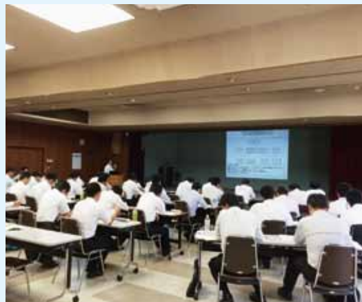
写真は、7月19日(土)開催の研修会の模様です。48名の営業職員等が参加し、熱心に研修に取り組みました。

経営者の高齢化が進み、後継者不在といった状況の中で、事業承継問題が一段と顕在化してきています。 事業承継が円滑に進まなければ、地域経済の活力の維持、地域の雇用の維持、さらに地域コミュニティ(地域社会)そのものの維持にも支障を来すことになりかねません。