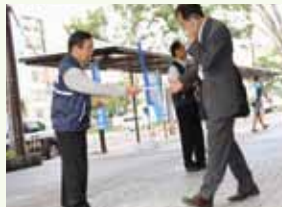
役職員による「花の種」配布 (甲府駅南口)