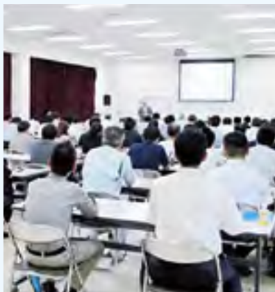
一流デザイナーを招いてのデザインセミナー