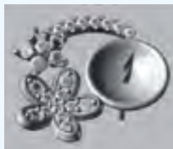
3DCADでのジュエリーの設計画面

デザインセンターでは、「変化し続ける社会において、技術力とともにデザイン力の高度化も不可欠。引き続き県内企業並びにデザイナーの皆様の創造活動に対する支援を通じて、山梨のデザイン振興を図っていきたい。」と抱負を語る。身近なデザインの話。企業の皆様には是非お気軽にご相談してみられては。(お電話は総合相談・研究管理科へ)