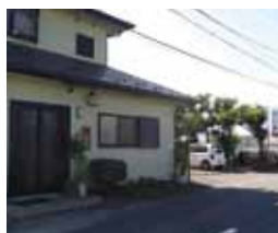
⑫ふじみ食堂 中央市井之口130-3 055-273-5837