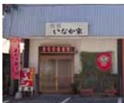
⑭いなか家 中央市布施2459 055-273-5297