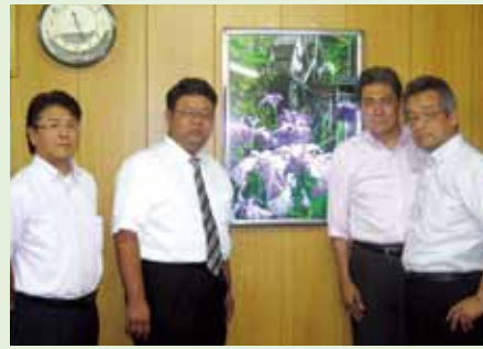
開発スタッフの方々

日興製作所は笛吹市御坂町に本社・工場、鹿児島県出水市に工場があり、樹脂成型をメインに半導体等の搬送トレイや金型製造を行う五十一年以上の歴史を誇る会社です。主な取引先には京セラ(株)、ソニー