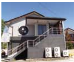
①酒彩 縁屋 中央市布施2459 055-273-8882