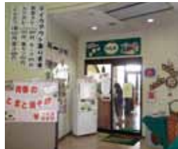
⑩道の駅とよみ ふるさとカフェシルク 中央市浅利1010-1 055-269-3424