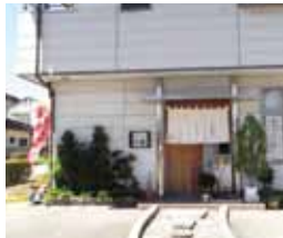
⑦日本料理 ミツ橋 中央市山之神2196-1 055-273-8777