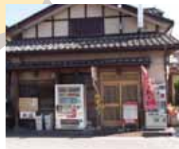
⑤末広 中央市西新居1-83 055-273-0696