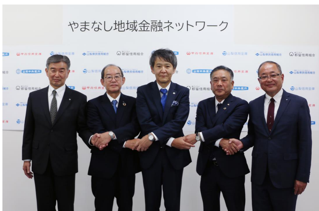
【連携協定を締結した各金融機関の代表者】