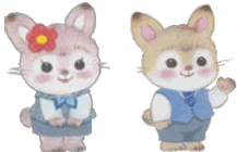
うさみん うさけん

※審査の結果によっては、ご希望に添えない場合もございますので、予めご了承ください。 ※このローンの条件に合わない方でも、6次産業化などの事業化を検討される方はご相談下さい。